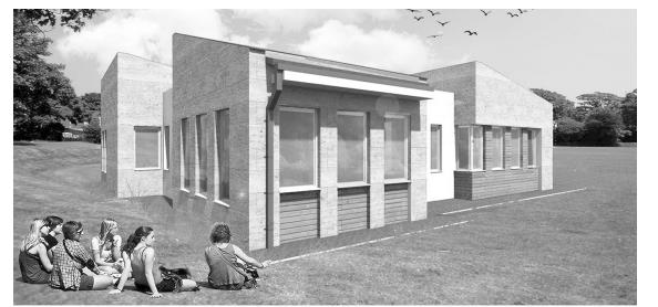
Az új egészségház látványterve

Ha a beruházások és a jelentős felújításokat nem számítjuk, akkor nagy vonalakban az előző évekhez hasonló nagyságrendű bevételeket és kiadásokat tartalmaz a költségvetés.