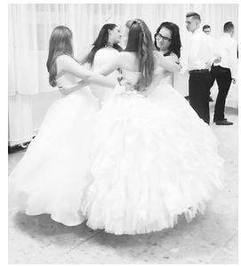
Nagy sikert aratott a gyerekek nyitótánc

Az intézmény vezetése ezúton is köszöni a segítséget mindenkinek, aki részt vett a szervezésben, a lebonyolításban, valamint tombola felaján-