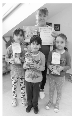
A rajzpályázat vajai díjazottjai

Jelenleg így fest a tabella: 1. Piremon SE 39,5 pont, 2. Nyíregyházi SISE 32,5 pont, 3. Vajai II. Rákóczi Ferenc SE 31 pont, 4. Kisvárdai SC 30,5 pont, 5. Dávid SC 27,5 pont, 6. Fehérgyarmati SE 26 pont, 7. Nagyhalászi SE 18,5 pont, 8. Nyírbátor SE 17,5 pont, 9. Balkány Cellspan SE 17 pont.