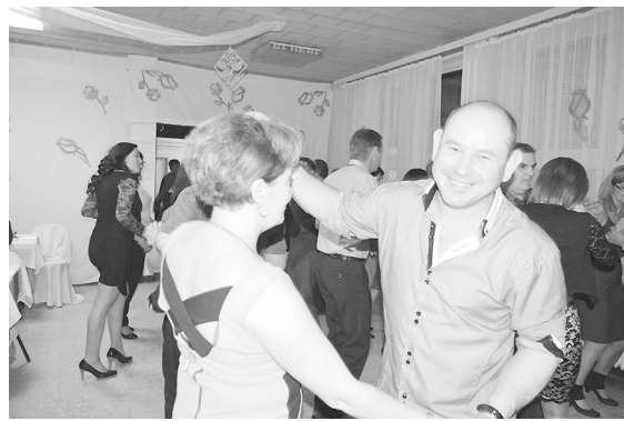
A bálban senki sem volt híján a jókedvnek