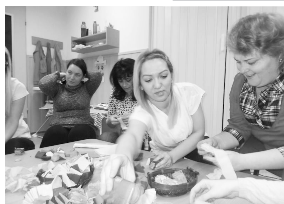
Az anyukák örömmel vettek részt a munkában

Az aktuális ügyek megvitatása után beszélgetésre hívták a résztvevőket, akik feladatot kaptak: girlandokat és más díszítéseket készítettek a gyermekintézmény számára.