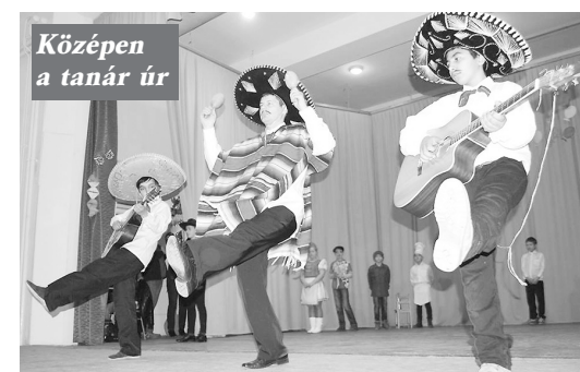
Középen a tanár úr

Teltház előtt, a művelődési otthonban mutatták be farsangi műsorukat az általános iskolás gyermekek. Minden osztály külön programmal készült, s felléptek a mazsorett és modern tánc csoportok is. Egyik-másik produkcióban pedagógusok erősítették a csapatokat, igen nagy sikert aratva. A résztvevőket büfé várta és nem maradt el a tombola sorsolás sem. Akik ott voltak, elismeréssel szóltak a farsangi rendezvényről, ami a gyermekek, pedagógusok és szülők közös munkájának eredménye.